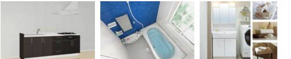
■この設備で賃貸?! キッチン2250mm、お風呂1616タイプ、三面鏡洗面台