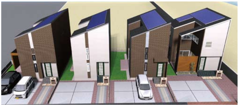
■シンプルながら機能美を追求したデザイン 中庭をつくる事により各棟の採光を確保しております。屋根は太陽光でもっとも効率の良い3.5寸勾配屋根となっております。

CREST TOWN 美乃利 省エネ エコジョーズ 太陽光発電 安心 セキュリティ 快適 ミストカワック 省エネ・快適・安心な商品が標準装備マハロシリーズ最高峰のエコ賃貸です。